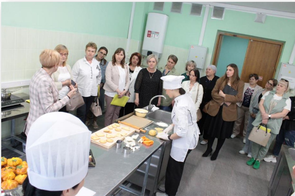
Мастер-класс «Использование изомальта в декорировании кондитерских изделий»